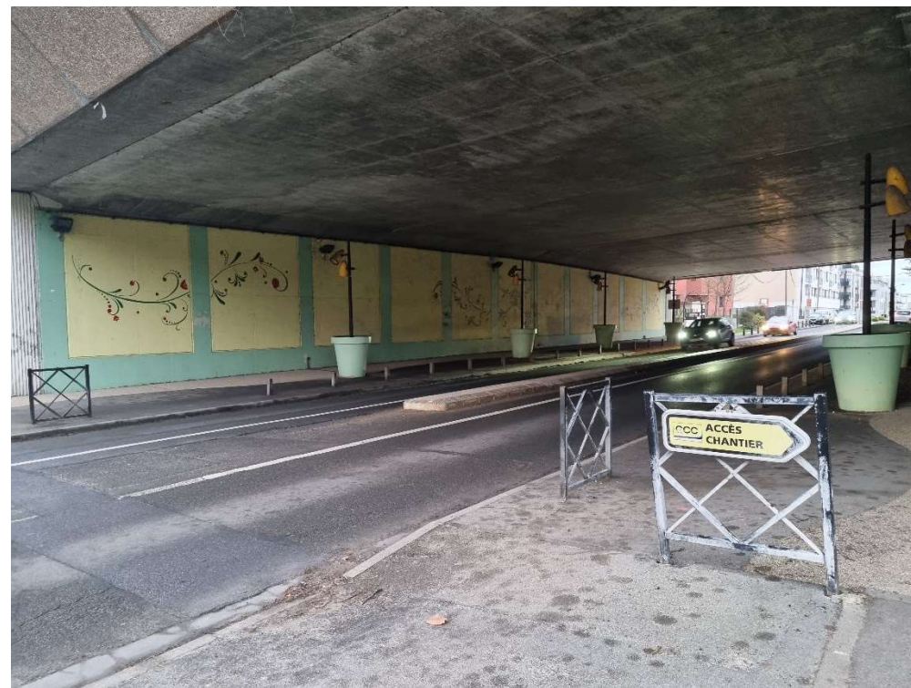
Figure 3 Vue du pont autoroutier au-dessus de la Route Départementale D11 qui unit Saint-Cyr-l'École et Fontenay-le-Fleury