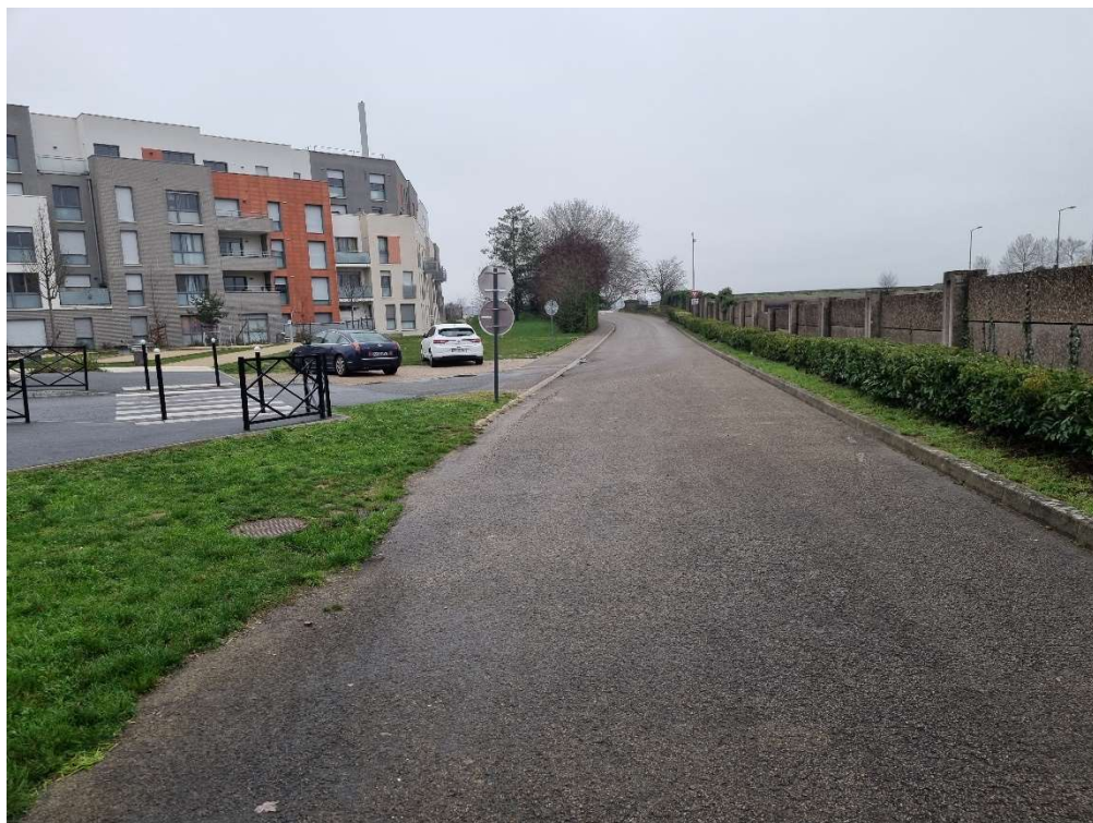
Figure 2 Vue de la partie de la rue Georges Bizet appartenant actuellement à la commune de Saint-Cyr-l'École