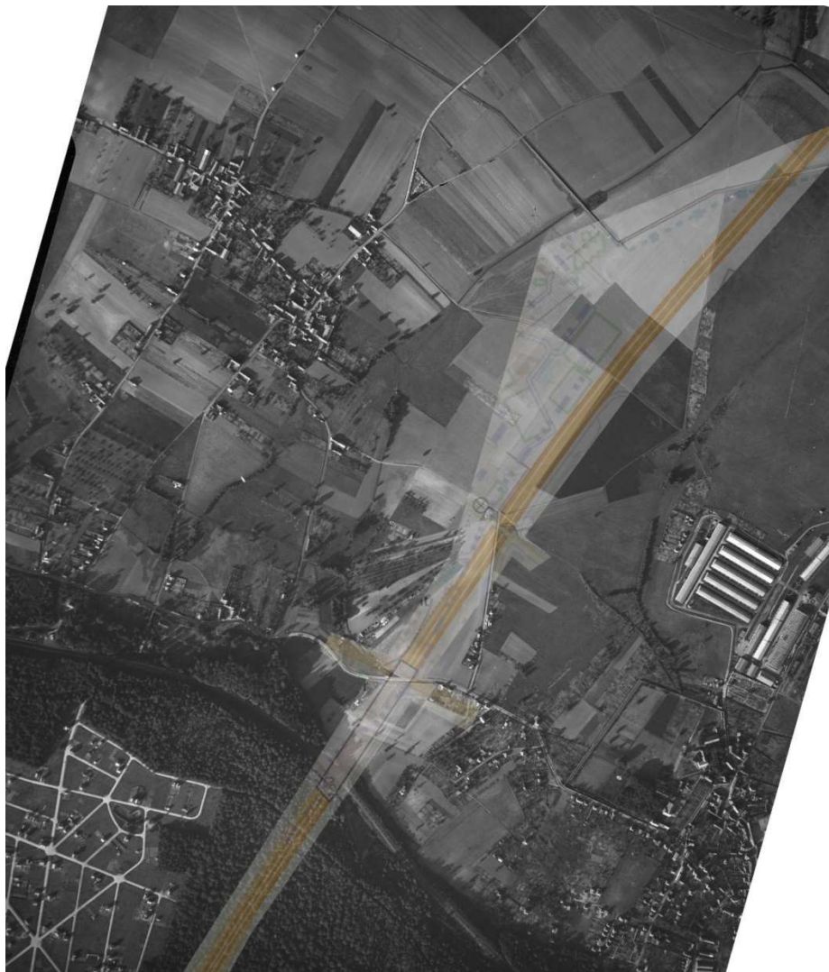
Figure 5 Superposition du tracé de l'autoroute A12 sur une vue aérienne de juillet 1933

Il est intéressant de reporter le trajet de l'autoroute sur la vue aérienne de 1933