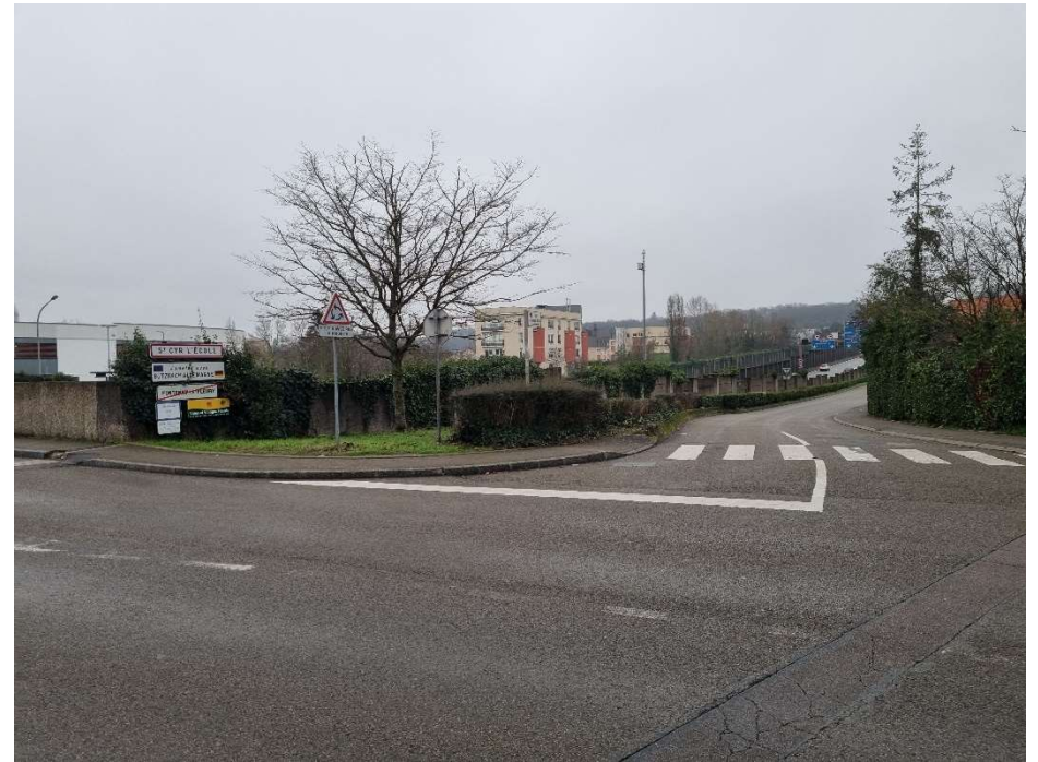
Figure 1 Vue de la rue Georges Bizet avec à gauche l'autoroute et la ville de Saint-Cyr-l'École et à droite la ville de Fontenay-le-Fleury