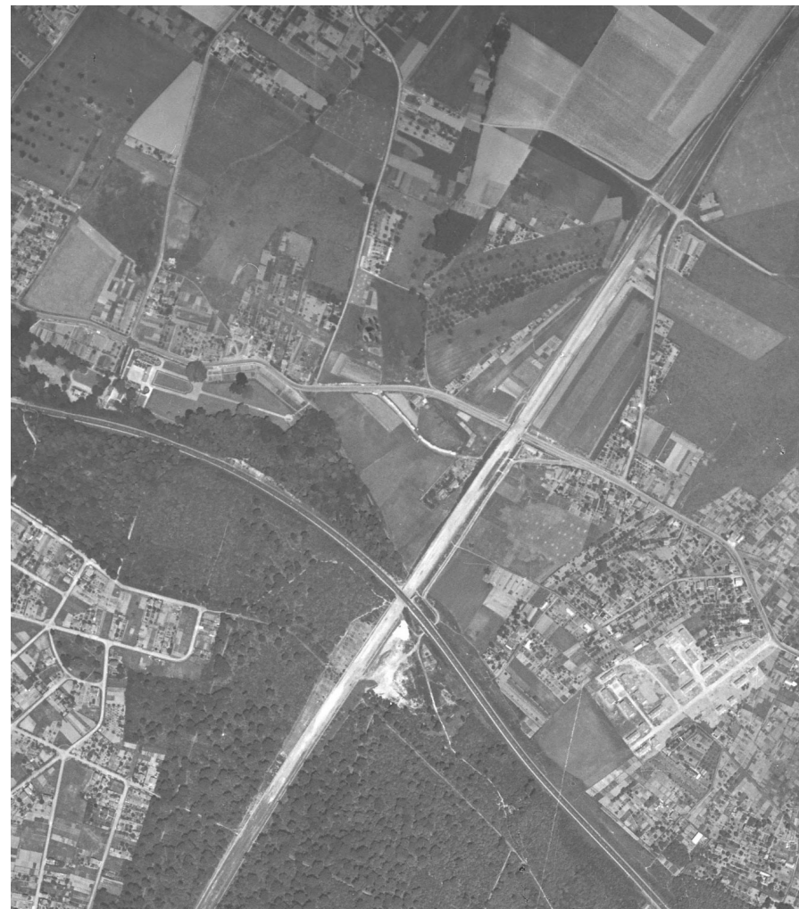
Figure 4 Construction de l'autoroute A12 en juin 1949

terminés, le dévoiement de la départementale 11 réalisé, mais que la chaussée de l'autoroute n'est pas achevée.